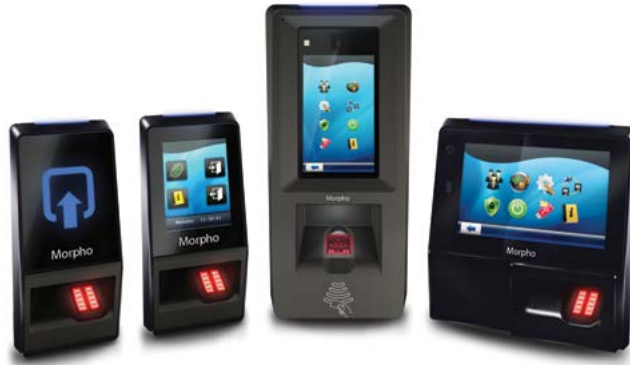
عائلة THE SIGMA

(1) يعتمد دعم التواصل قريب المدى على طراز الهاتف الذكي المستخدم مع أجهزة MA SIGMA Lite/Lite+